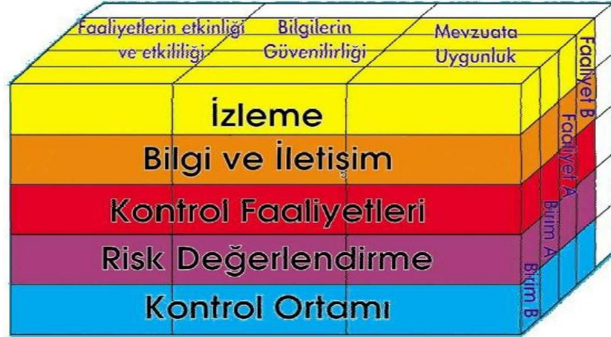
Şekil 1: COSO Küpü

İç Kontrol standartları, idarelerin, iç kontrol sistemlerinin oluşturulmasında, izlenmesinde ve değerlendirilmesinde dikkate almaları gereken temel yönetim kurallarını göstermekte ve tüm kamu idarelerinde tutarlı, kapsamlı ve standart bir kontrol sisteminin kurulmasını ve uygulanmasını amaçlamaktadır.